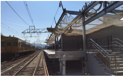
写真① 可部駅構内の工事状況