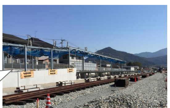
写真⑥ 終点駅の工事状況